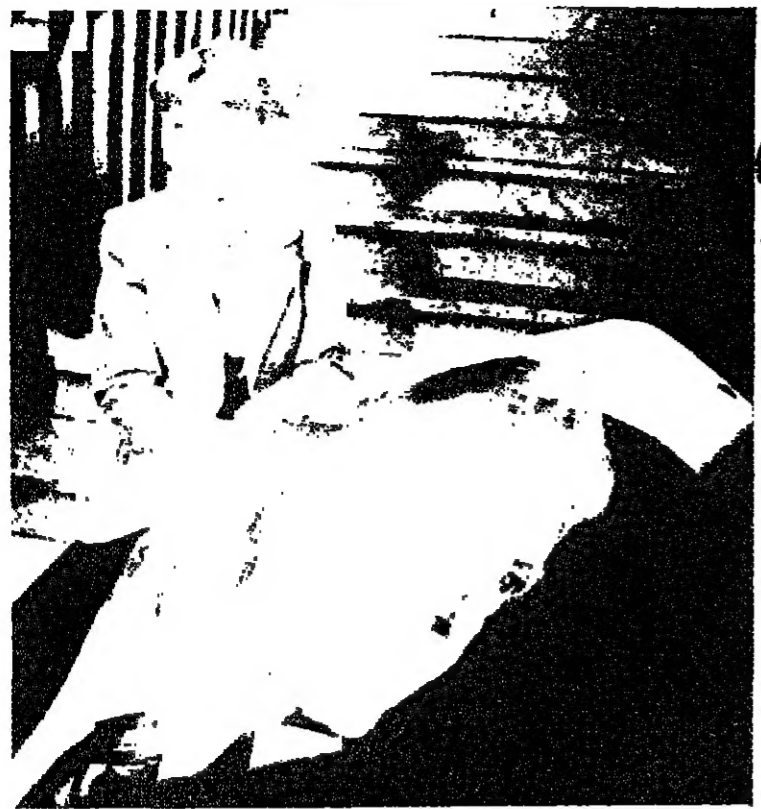
شابة من انصار الرئيس جيمي كارتر تحمل صورة له كانت قد الصقت على احد الجدران خلال المعركة الانتخابية وعلامات الحزن والاسى بادية على وجوها .

الرئيس الاميركي المنتخب يعان عن رغبته في الاجتماع بملك الاردن المرديات المتحدة تزيد من ميزانيتها العسكرية لتعزز قوتها الدفاعية